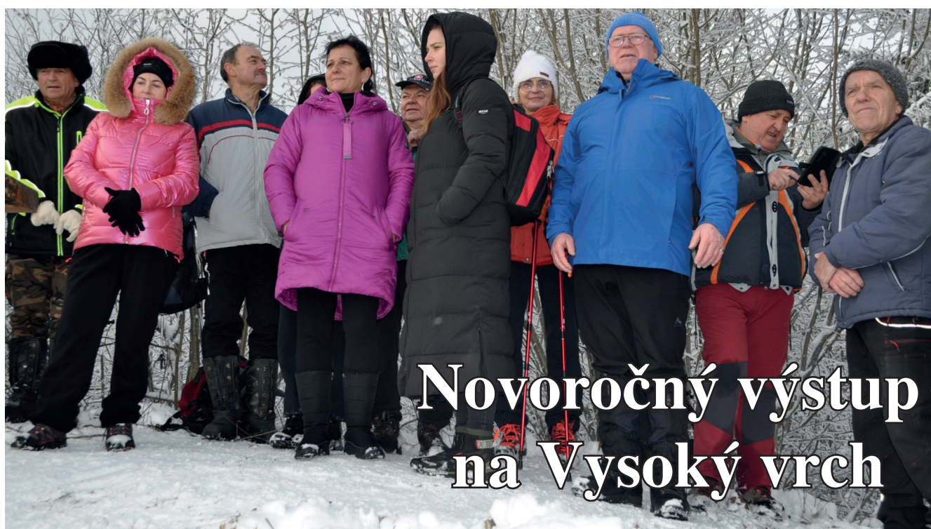
Novoročný výstup na Vysoký vrch