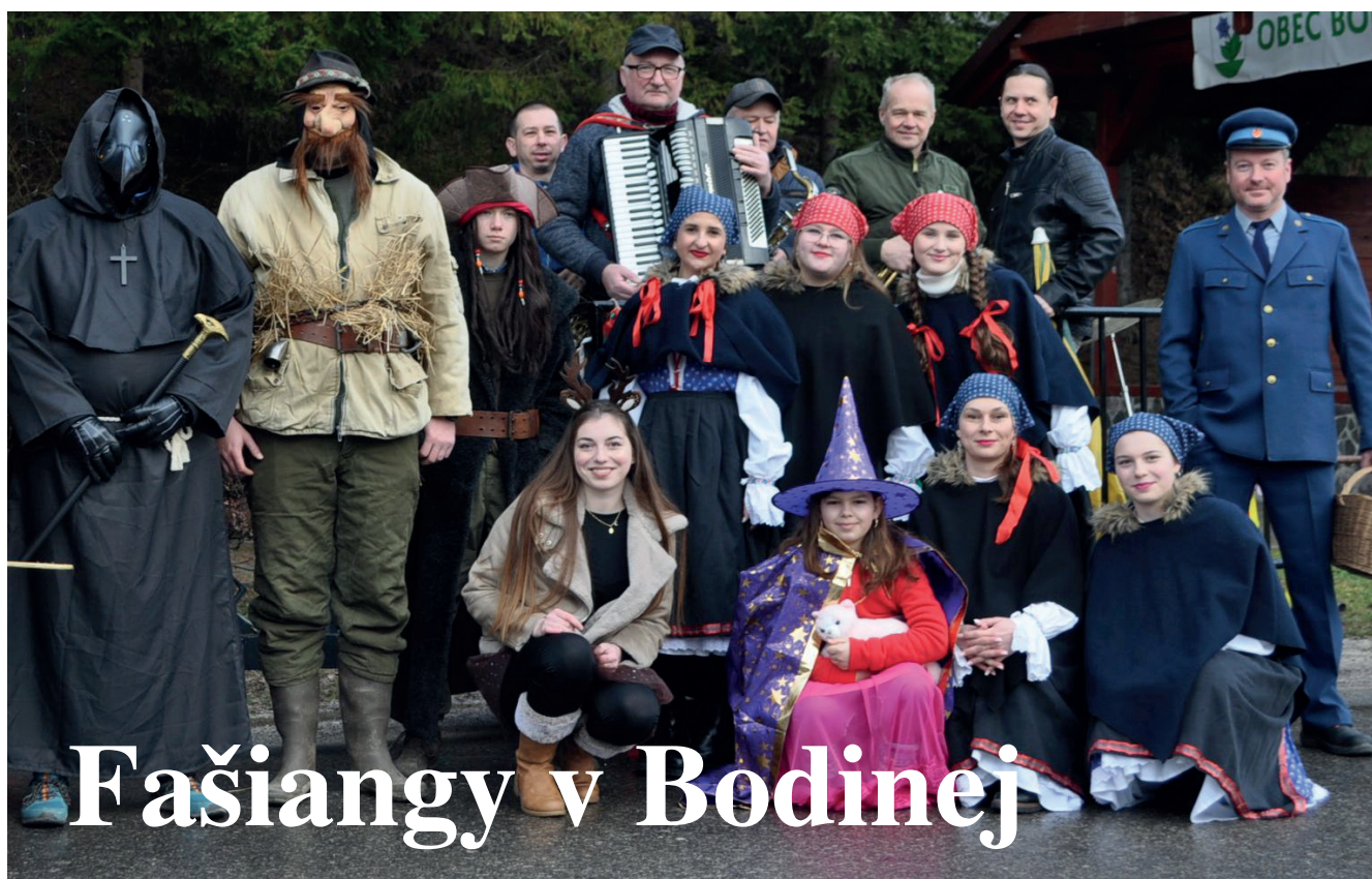
Fašiangy v Bodinej

INFORMAČNÉ NOVINY PRE OBYVATEĽOV OBCE BODINÁ