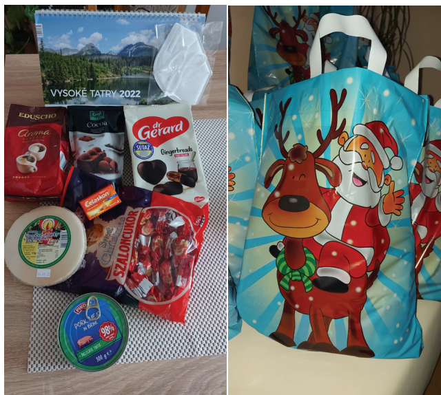
Obecný úrad v Bodinej zakúpil minulý rok pre seniorov nad 70 rokov vianočné balíčky.